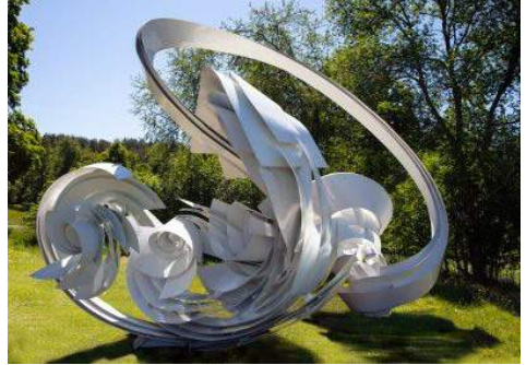
Hoop-La, verk i aluminium och stål av Alice Aycock, Skulpturparkens första konstnär.

med målsättningen att etablera en permanent skulpturpark på Kungl. Djurgården. För närvarande finns fyra monumentala skulpturer i samlingen och varje år