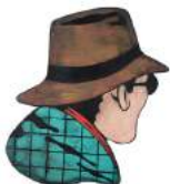
Målning Jan Häfström 160.000 kr