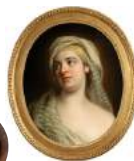
Alexander Roslin målning 250.000 kr