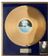
Guldskiva ABBA 160.000 kr

Vi lägger stor vikt vid att presentera varje föremål optimalt i både text och bild. Man skulle kunna säga att vi ställer dem på piedestal i ett ojämförligt skyltfönster mot världen. Välkommen att kontakta oss för hembesök och värdering av såväl hela hem som enstaka föremål och särskilt samlingar, som blivit något av vår specialitet!